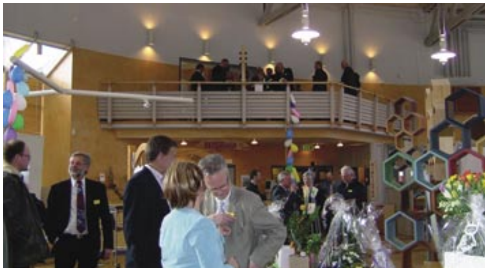
Många ville vara med och fira när Träcentrums anläggningar fyllde tio år.