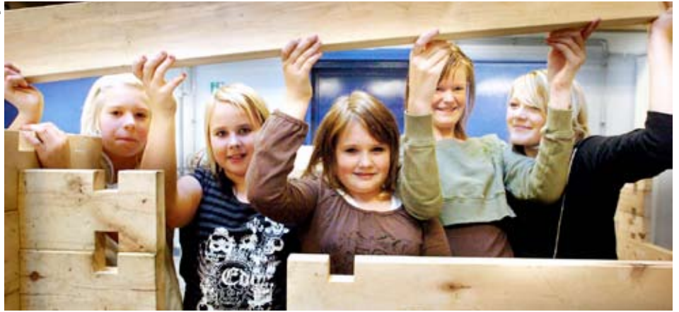
Bygglek är ett koncept för barn från ca 8 år, som innebär att barnen får leka fritt med en byggsats.